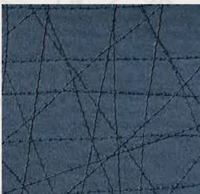
midnight blue F5076101