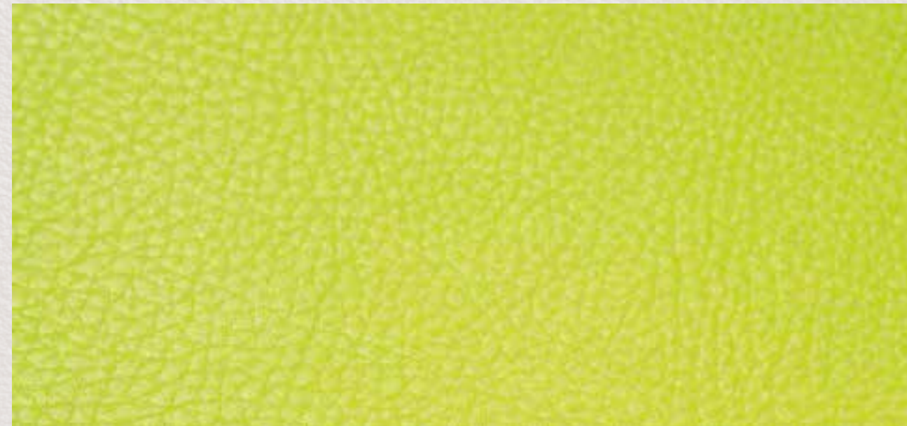
skai® Parotega NF limone F6461657

High-quality skai® material with a classic leather grain. Due to its natural look and touch one can hardly differentiate between this material and genuine leather. The material is especially suitable for the contract area, for public buildings and institutions.