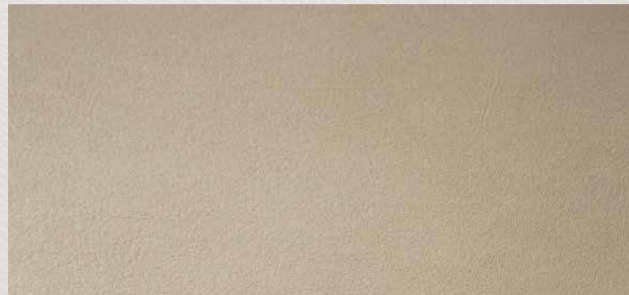
skai® Palma NF birke F6411152

High-quality skai® material with a fine-structured calf leather grain and a subdued printing. The material is all-purpose and especially suitable for the contract area, for public buildings and institutions.