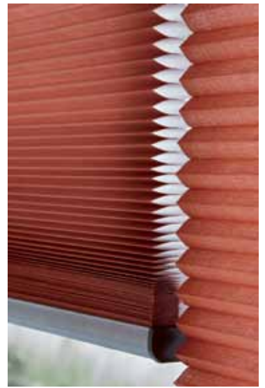
Les Stores Duette® conviennent parfaitement pour le bureau, lui donnant un aspect chaleureux et élégant.